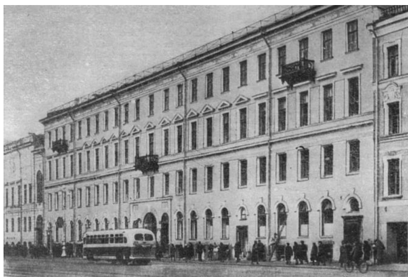
Фото из сети Интернет