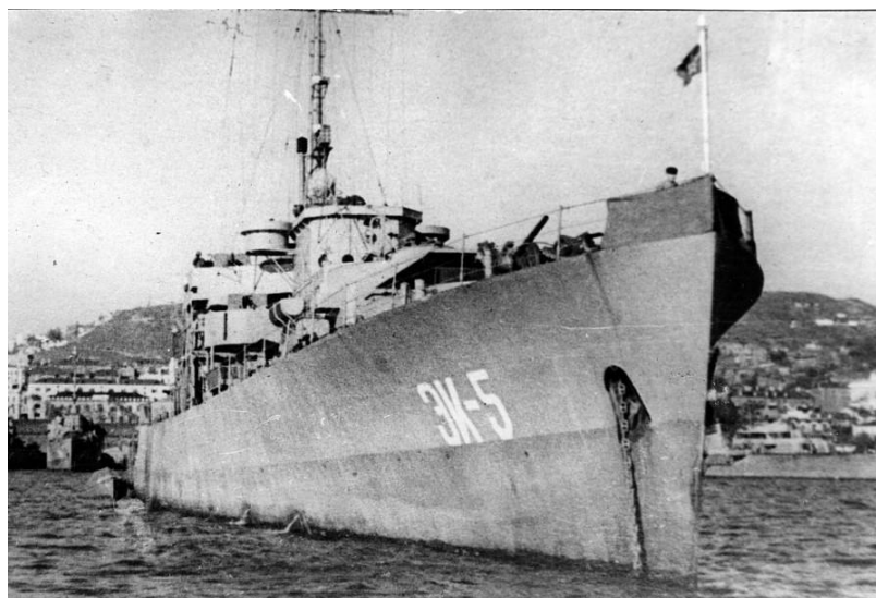
Эскортный корабль.

Раскроем содержание аббревиатуры и сокращений из этого документа. 44 омсп – это 44-й отдельный местный стрелковый полк в составе войск БО (Береговой обороны) главной военно-морской базы ТФ/ТОФ (Тихоокеанского флота) во Владивостоке. Сокращение «эк.» означает – эскортный корабль. Эскортный корабль: общее название кораблей, предназначенных для охранения транспортов (десантных судов), следующих в составе конвоев (десантных отрядов), от атак противника. В качестве эскортных кораблей во 2-й мировой войне использовались специально построенные миноносцы, корветы, фрегаты и другие корабли 8 .