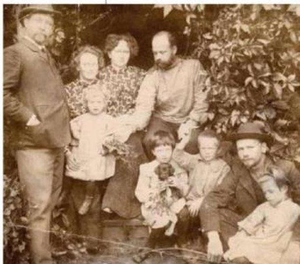
Семья Васильевых и Козловых в Оночке. 1904 год