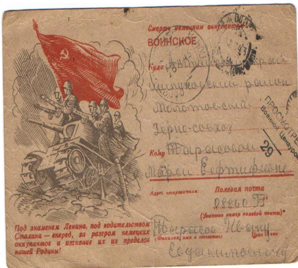
Рис. 1 Немаркированная иллюстрированная односторонняя почтовая карточка. Письмо из семейного архива Слизова А.В.