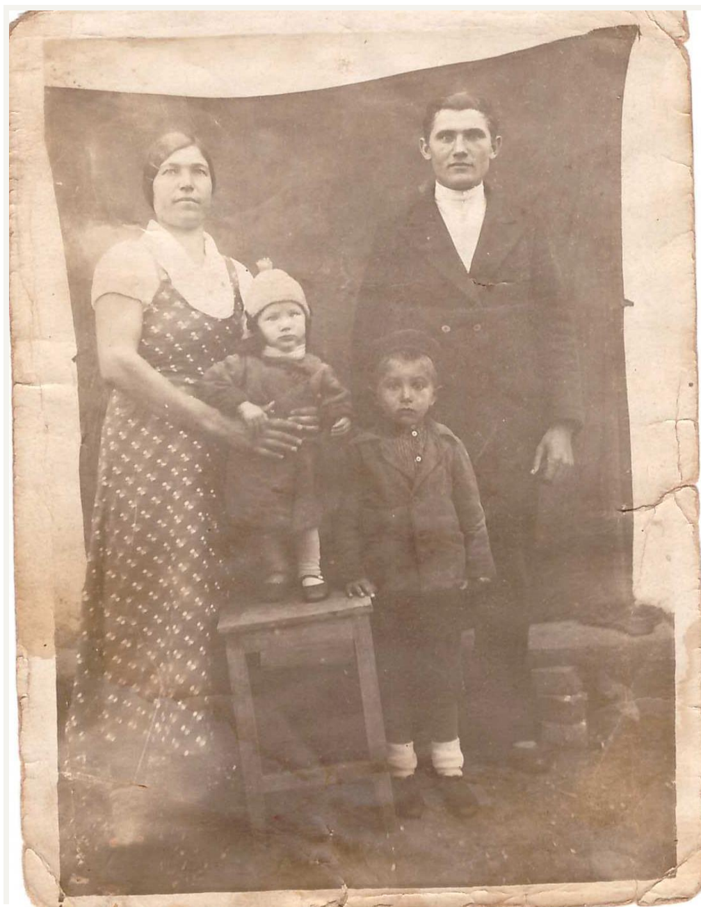
Рис. 7 Фотография семьи Тарасовых.