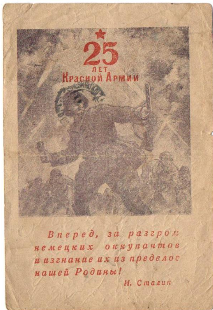
Рис.2 Немаркированная двусторонняя иллюстрированная почтовая карточка.