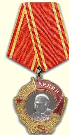
Орден Ленина 1971г