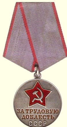
Медаль «За трудовую доблесть» 1966г