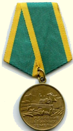
Медаль «За освоение целинных земель» 1957г