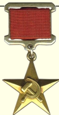
Золотая Звезда Героя Социалистического Труда