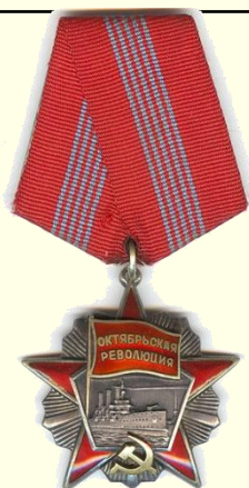
Орден «Октябрьской Революции» 1980г