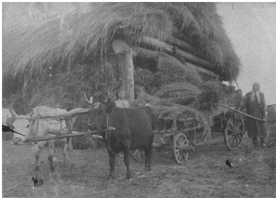
6. Строительство жилищ и других построек в одном из спецпоселков Зачулымья в 1930-е годы. III спецпереселенческий участок.