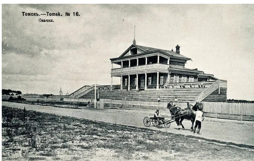
Томскъ.—Tomsk. № 16. Скачки.

В СССР использовался для пропаганды социалистического образа жизни. В 1936 году также на ипподроме был проведен очередной Сабантуй.