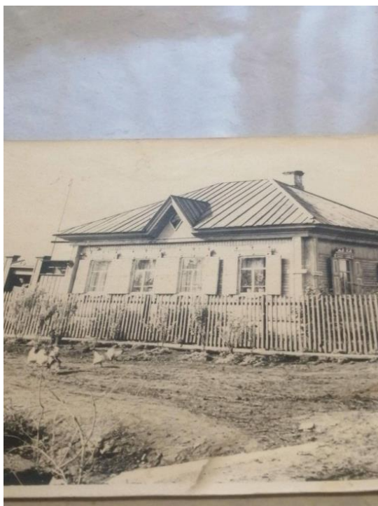
Дом на Менделеева,1.