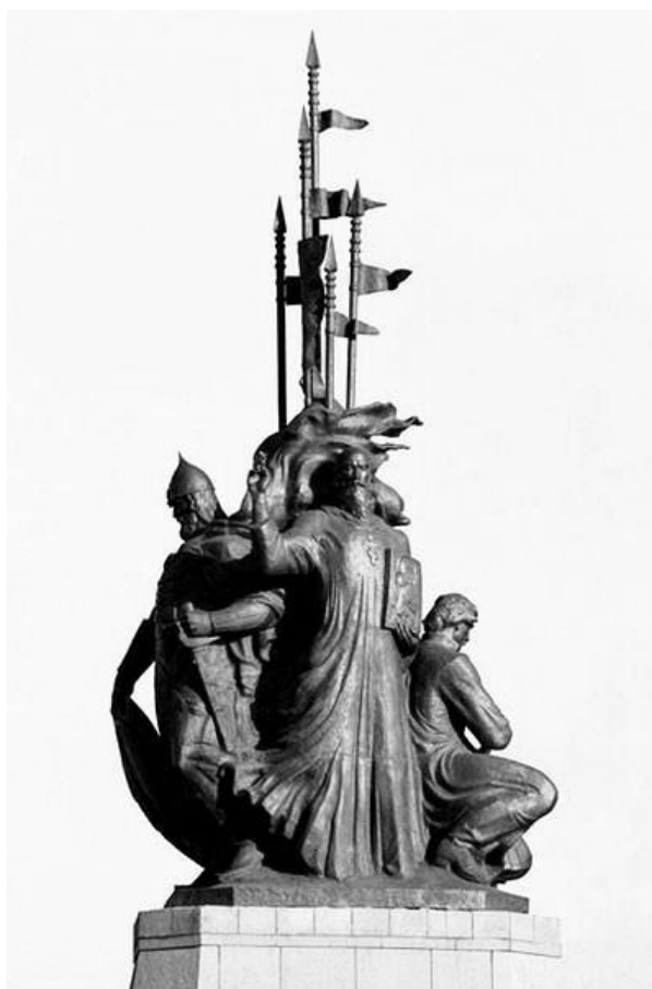
Памятник основателям Сургута*

«В покорении и освоении Сибири казаки сыграли роль исключительную, почти сверхъестественную. Только особое сословие людей дерзких и отчаянных, не сломленных тяжёлой русской государственностью, чудесным образом смогло сделать то, что удалось им. После них подобных людей, кажется, уже и не случалось, они были тем, что можно назвать «самострелами» русского духа. Для осознания их изнурительного подвига не хватает воображения, оно, воображение наше, не готово следовать теми долгими и пешими путями, какими шли сквозь Сибирь эти герои...»