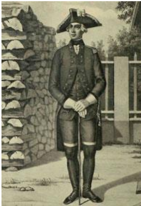
Историческое описание одежды и вооружения российских войск Горнозаводские войска 1764 - 1771 годы