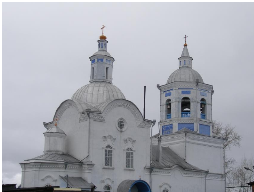
Воскресенская церковь в Тогуре.