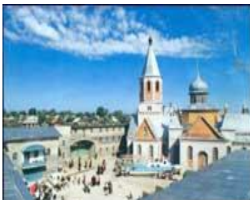
Нарым. Литография 1890 г. Художник П. Кошаров.