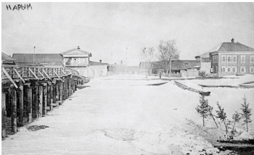
Мост через протоку Полой в Нарыме (не сохранился)