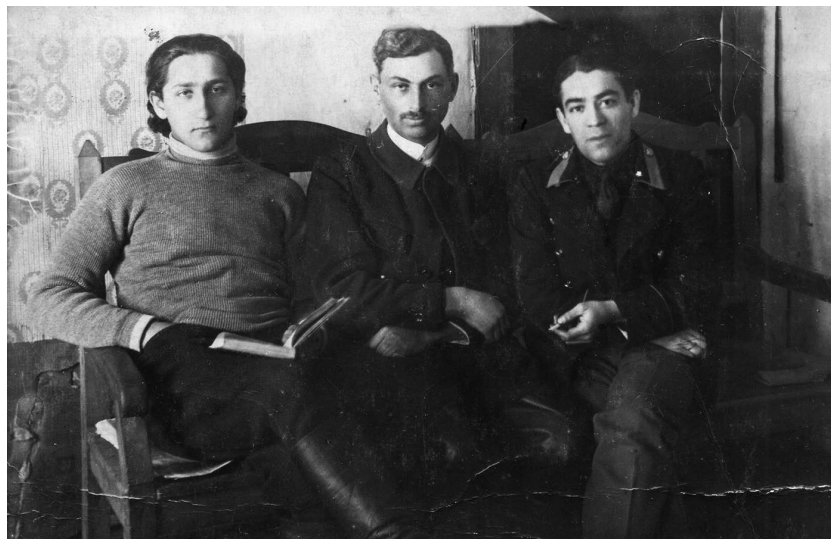
В ссылке с друзьями анархистами-коммунистами

К началу 1915 года милитаристские настроения в обществе под влиянием вызванных войной социально-экономических трудностей явно пошли на спад.