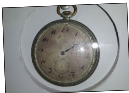
Documents in the historical museum of Volkovysk on the activities of the watchmaker Schiff Meer