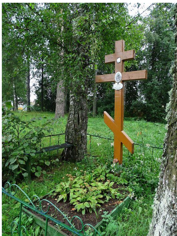
«Под сим памятником погребено тело строителя сего монастыря игумена Нила, скончавшегося в 1902 году ноября 6-го дня, от рождения 37 лет» 4 .