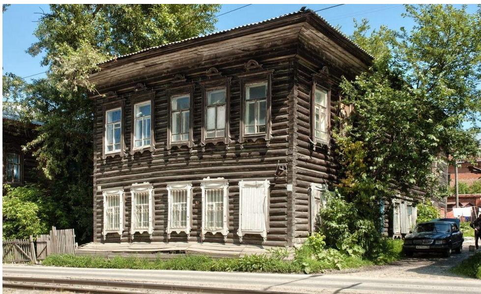
г. Томск, улица Советская, дом 64. Снято в 2009 году. В 1930-х годах на его территории находились два двухэтажных деревянных дома и погреб. К 2000-м годам уцелел только один дом 1 .