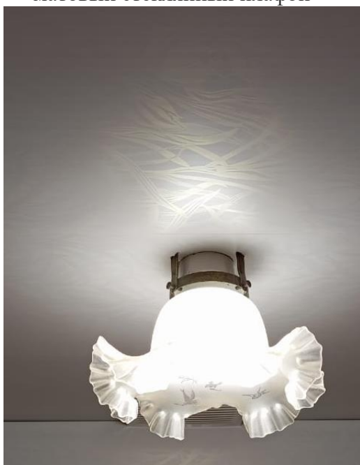
Тот самый плафон 1 .