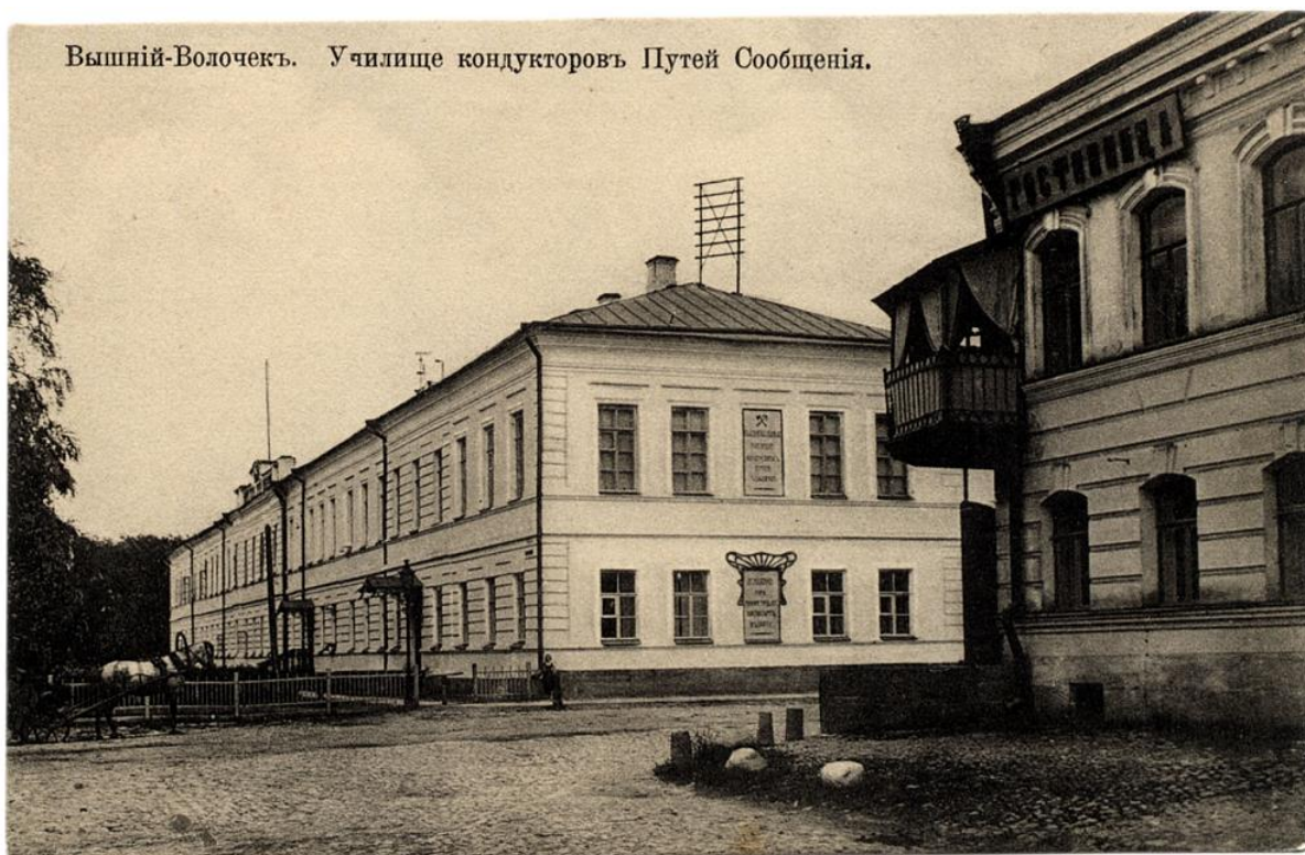
С открытки XX века.

При поступлении мальчики подвергались "состязательному испытанию из математики и русского языка в объёме курса означенных училищ". Экзамены проходили 2 дня, один день русский письменно и устно, второй - математика письменно и устно. Кроме экзаменов мальчики должны были пройти "предварительный медицинский осмотр".