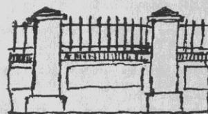
Ограда польского кладбища (рис. П.В. Хандорина)