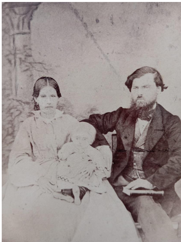
Фото подписано: 1-го июля 1866-го года.