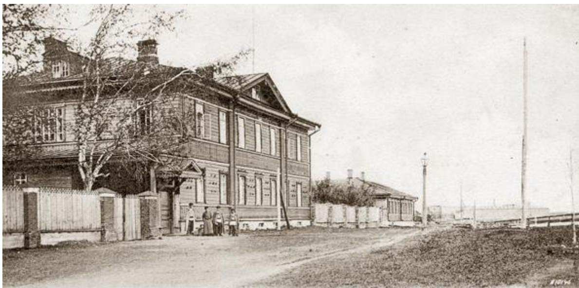
г. Вышний Волочёк. Общежитие кондукторов.

Согласно параграфу 32 Устава учащиеся, окончившие полный теоретический курс в училище, получали свидетельство, а после прохождения двухлетней практики "удостаивались аттестата на звание кондуктора путей сообщения" 10 .