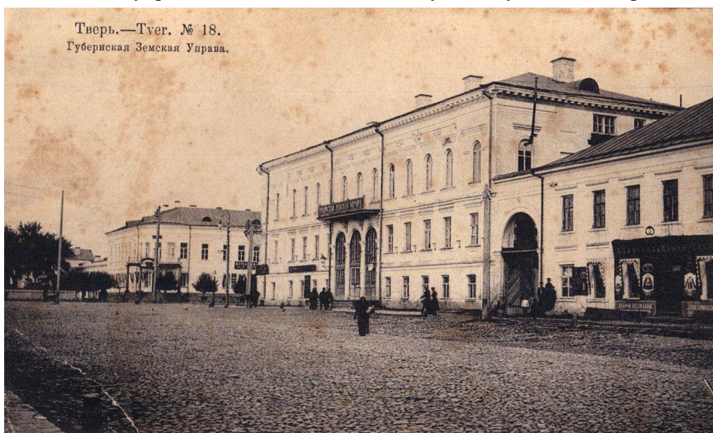
г.Тверь. Губернская Земская Управа, начало XX века (из свободного доступа).

В 1903-1904 годах работала писцом в Страховом отделе в Тверской Губернской Земской управе 14 . Об этом свидетельствуют документы, которые мы получили.