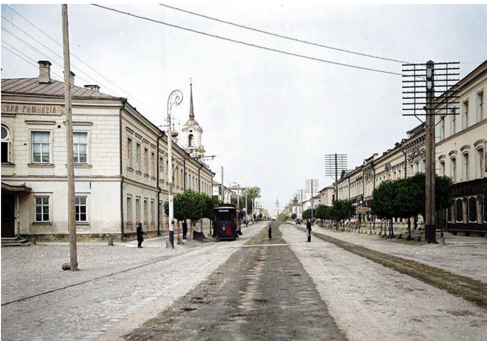
1903 год. г. Тверь, Миллионная улица, центральная улица города (из свободного доступа).

Самая младшая сестра. Была грамотная, но мы не знаем, где она получила образование. Жила в Твери на улице Миллионной в доме Малининой (ныне улица Советская - центральная улица Твери).