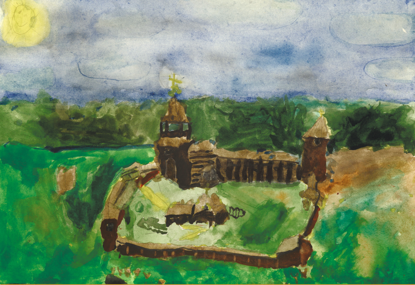
Закиров Тимур. Нарымский острог, 1596 год