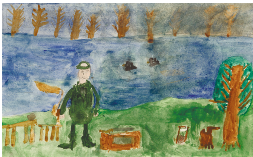
Сафонов Фёдор. Рыбалка на Оби