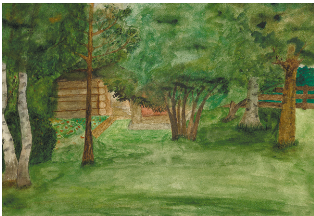
Закирова Эльвина. На музейной усадьбе

- Музей замечательный! Дома-то уже старые, часто аварийные. А если нет - много нового настроено. Что-то интересное вообще не сохранилось. А в музей заходишь - тут тебе и археология, и этнография, и ссыльные, и советский Нарым. Экскурсоводы, кстати, хорошие и могут провести экскурсию даже для одного гостя!