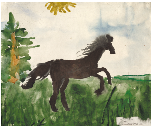
Тимур Закиров. Дух Нарыма