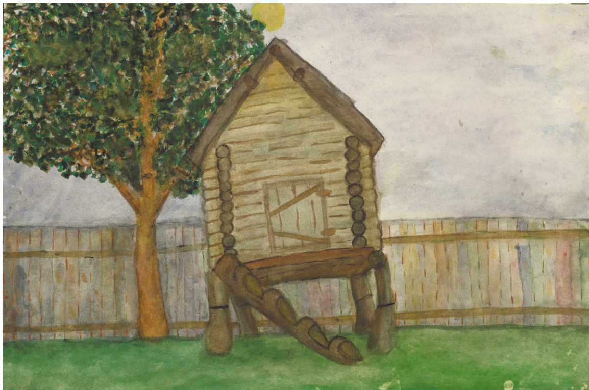
Сафонова Кира. Селькупский амбарчик во дворе музея

Но запасы селькупы, конечно, делают. Орехи, сушёные ягоды или ягодные лепёшки, сушёная или вяленая рыба, мясо. Их надо где-то хранить. И, чтобы звери не растащили, строят вот такие амбарчики «на куриных ногах», то есть на брёвнах.