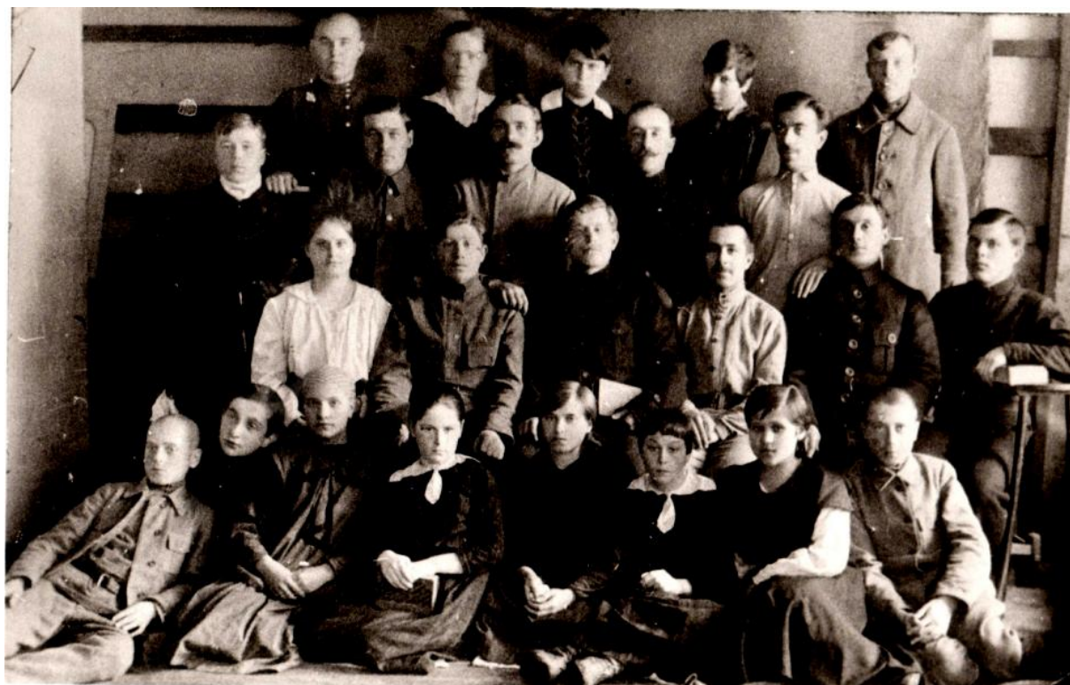
1925 г, верующие и проповедники, часть общины ЕХБ Томска.