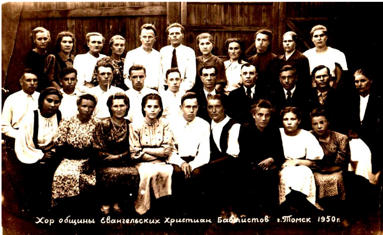
1950 год - хор общины ЕХБ Томска.