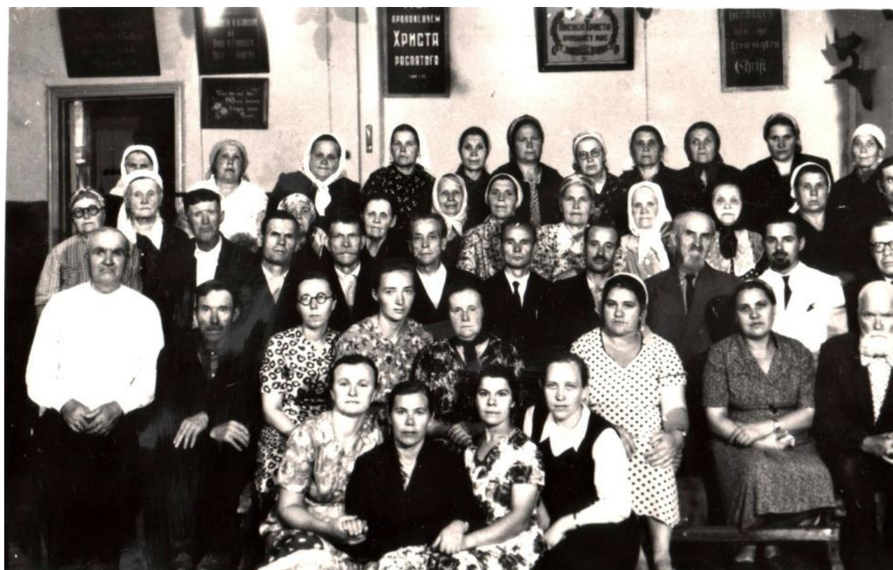
1965 год - члены общины ЕХБ Томска.