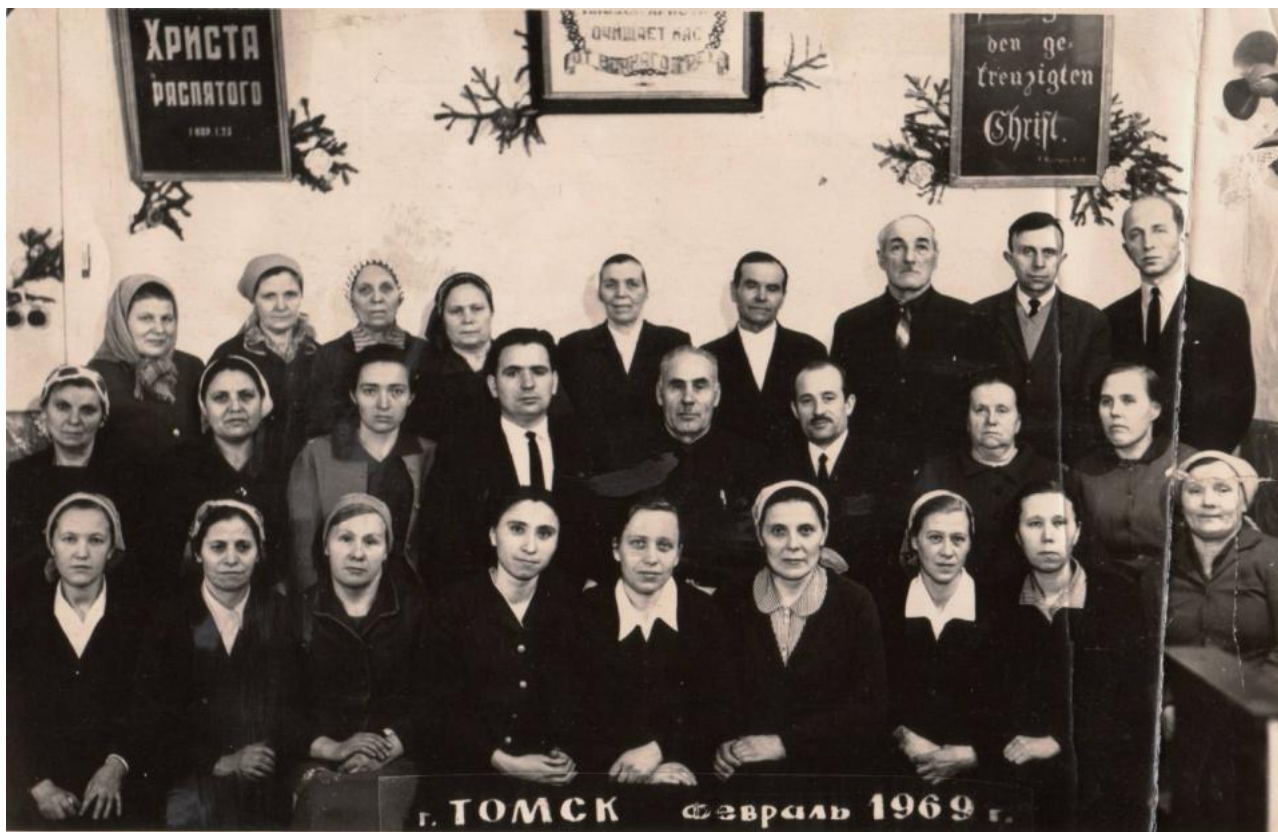
1969 год - активная часть верующих и проповедников церкви ЕХБ Томска.