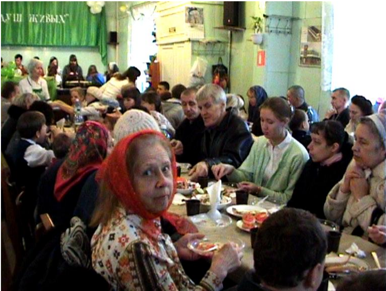
Торжественный обед в честь Юбилея Томской общины Евангельских Христиан Баптистов