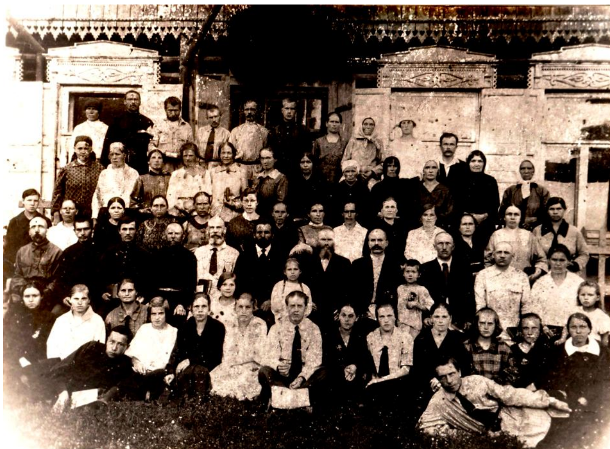
1924-26 г.г. участники хора общины ЕХБ Томска.