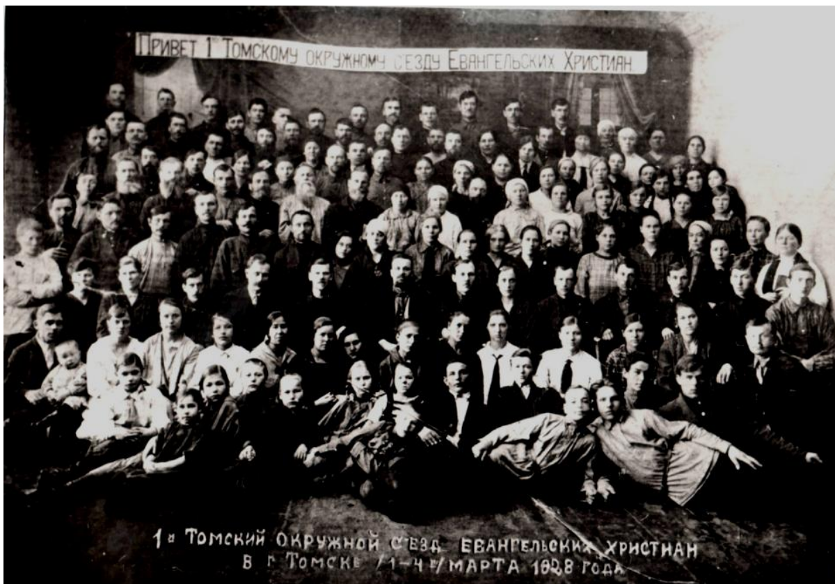
1928 год 1-4 марта окружной съезд ЕХБ в Томске.