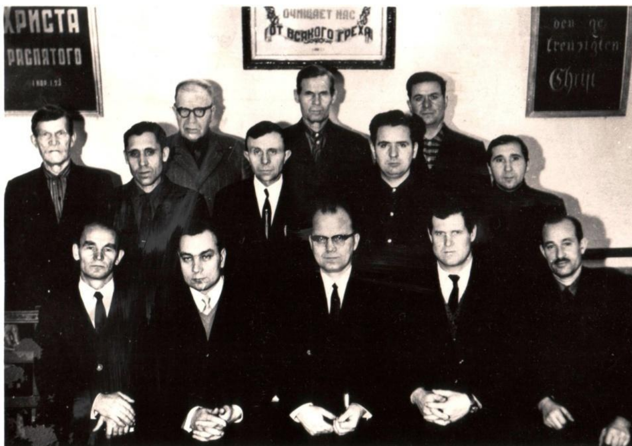
1970 год - служители немецкой группы церкви ЕХБ Томска.