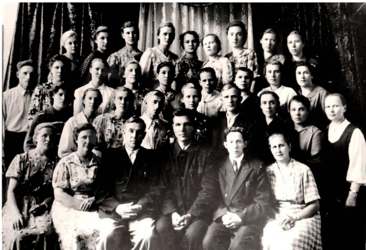
1966 год - участники хора общины ЕХБ Томска .