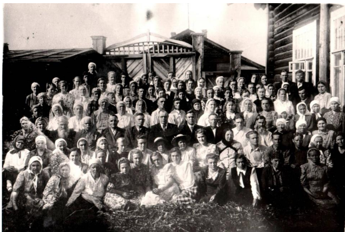
1968 год - община верующих ЕХБ г. Томска.