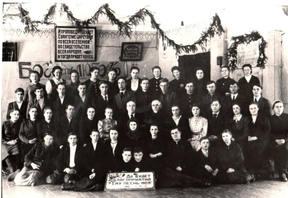
1948 год - участники хора общины ЕХБ Томска.